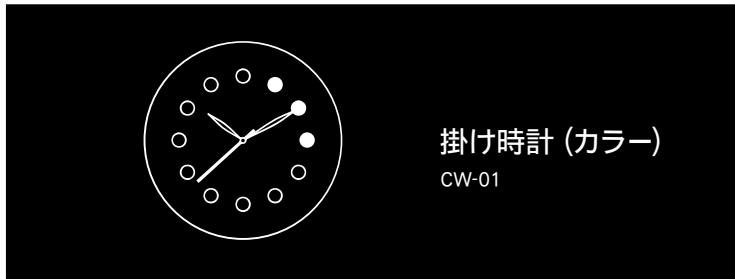
掛け時計 (カラー) CW-01

■お問い合わせ先 株式会社コサイン カスタマーサポート 〒079-8453 北海道旭川市永山北3条6丁目2-26 TEL. 0166-47-0123 / FAX.0166-47-7450 https://www.cosine.com