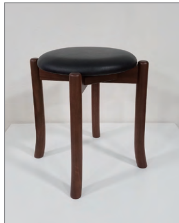
Lot.19 スツール座張り 〈張地プリマ 25 (黒)〉

メイベルトーコー [スペック] ウォールナット NA w480 × d480 × h460