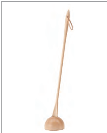
Lot.18 靴べら (L) と専用スタンド のセット

コサイン [スペック] メイプル オイル 靴べら (L) : w35 × d24 × h700 スタンド : w130 × d130 × h80