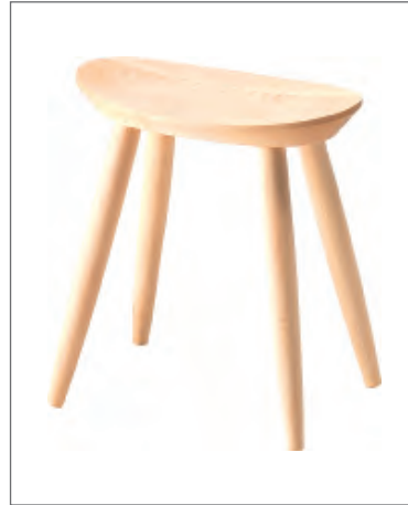
Lot.17 エントランススツール