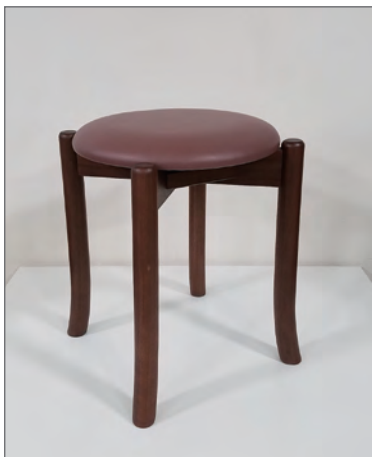
Lot.20 スツール座張り 〈張地プリマ 24 (茶)〉

メイベルトーコー [スペック] ウォールナット NA w480 × d480 × h460